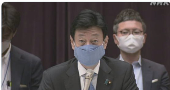
コロナ分科会「ワクチン接種の在り方 議論を」西村経済再生相 | NHKニュース [NHK] 新型コロナウイルス対策を検討する政府の分科会が開かれ、西村経済再生担当大臣は、ワクチンの接種の在り方などについて見解を示... @nhk.or.jp

本日の分科会で、ワクチン接種を議論しました。ワクチンの安全性・有効性は不明ですが、国民に必要なワクチン確保に全力を挙げるべきとのご指摘いただきました。現在、ファイザー社、アストラゼネカ社とワクチン供給の基本合意済みです。ワクチン確保に努めます。